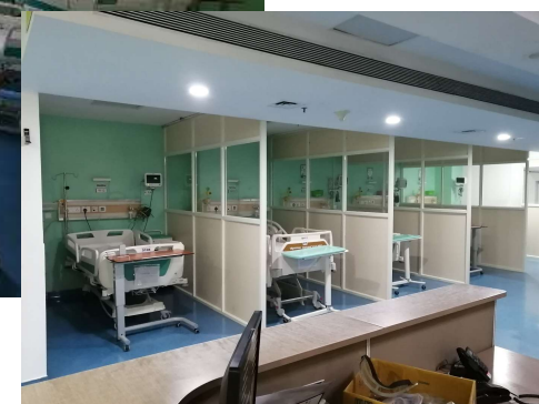
COVID専用ICU・HDU（G階救急を改造 24床）