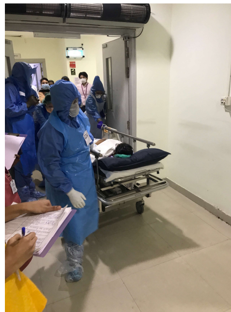
感染管理対策：専用リフトでの患者搬送等