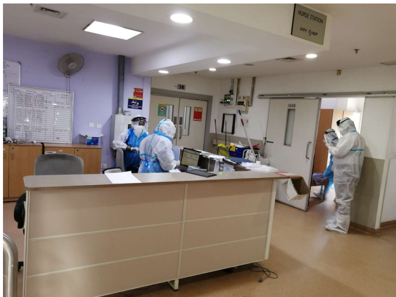
Covid専用病棟ナースステーション（計35床）