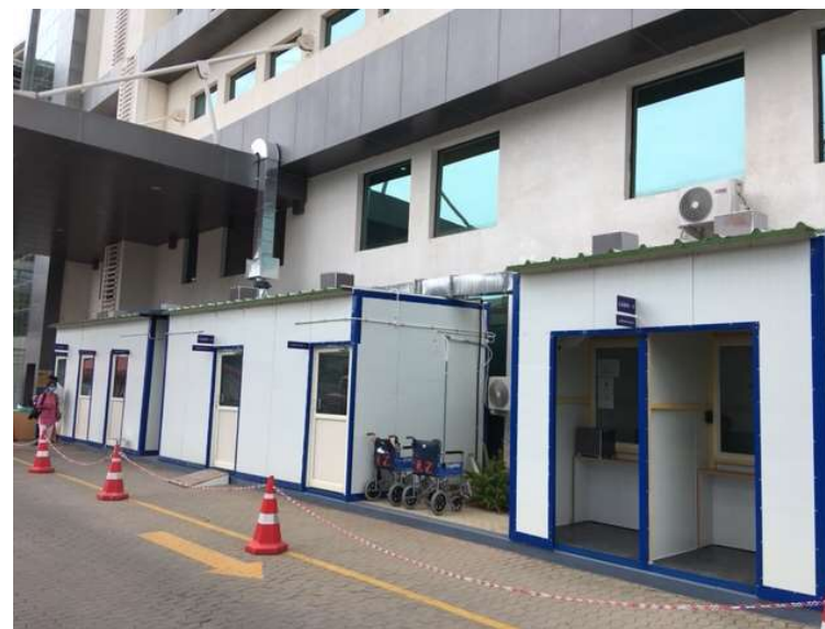
仮設キャビン 医師問診、PCRサンプル採取 (4月より運用開始)