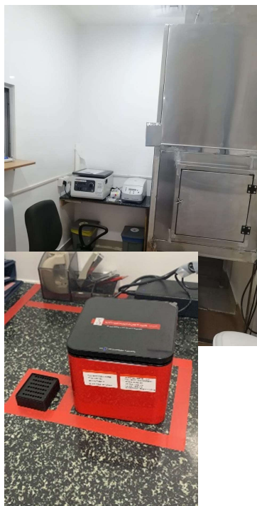
自院内PCRテスト施設（日当たり150件程度）