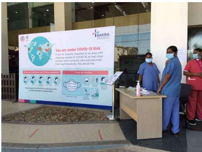
メインエントランス スクリーニング (3月8日より実施)